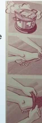
3. Quelle, S. 57

Wann zum KA: Wenn ihr Kind Atemnot hat (Pseudokrupp), wenn der abgehustete Schleim gelblich grün ist, wenn Ihr Kind länger als 2 Tage Fieber hat, (bei Sgl. sofort wenn Fieber dazukommt), wenn der Husten länger als 10 Tage andauert, (Achtung: er könnte chronisch werden).