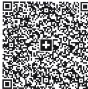
QR-Code Mitgliederkonto für E-Banking

Mitgliederkonto: Schwyzer Kantonalbank, IBAN CH58 0077 7008 7285 9450 9, PC-Konto 60-1-5, Spitex Sattel-Rothenthurm, Dorfstrasse 7, 6417 Sattel.